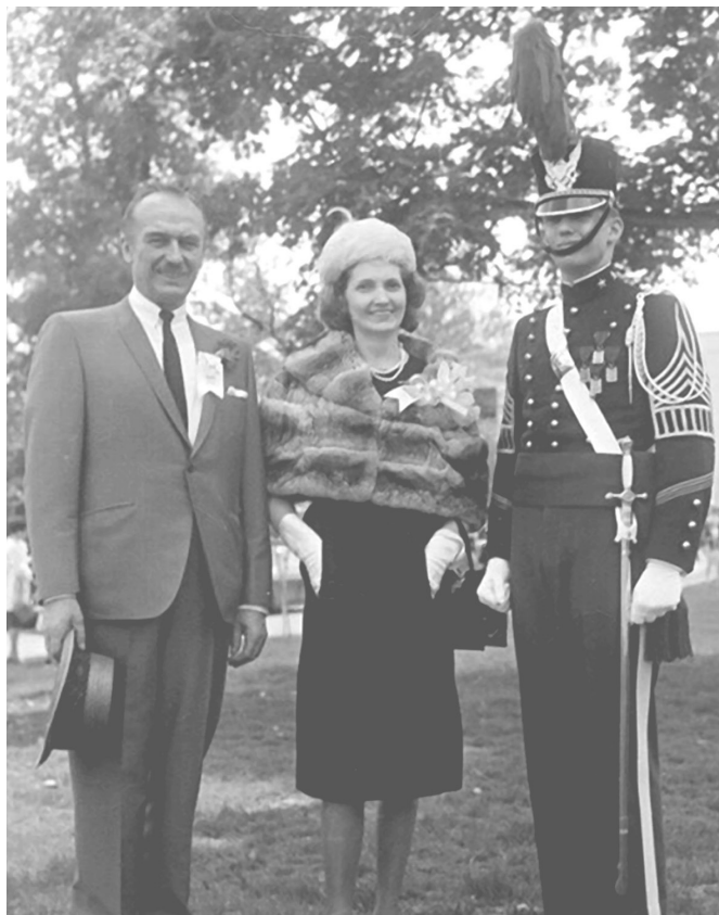
Доналд Тръмп с родителите си Фред и Мери