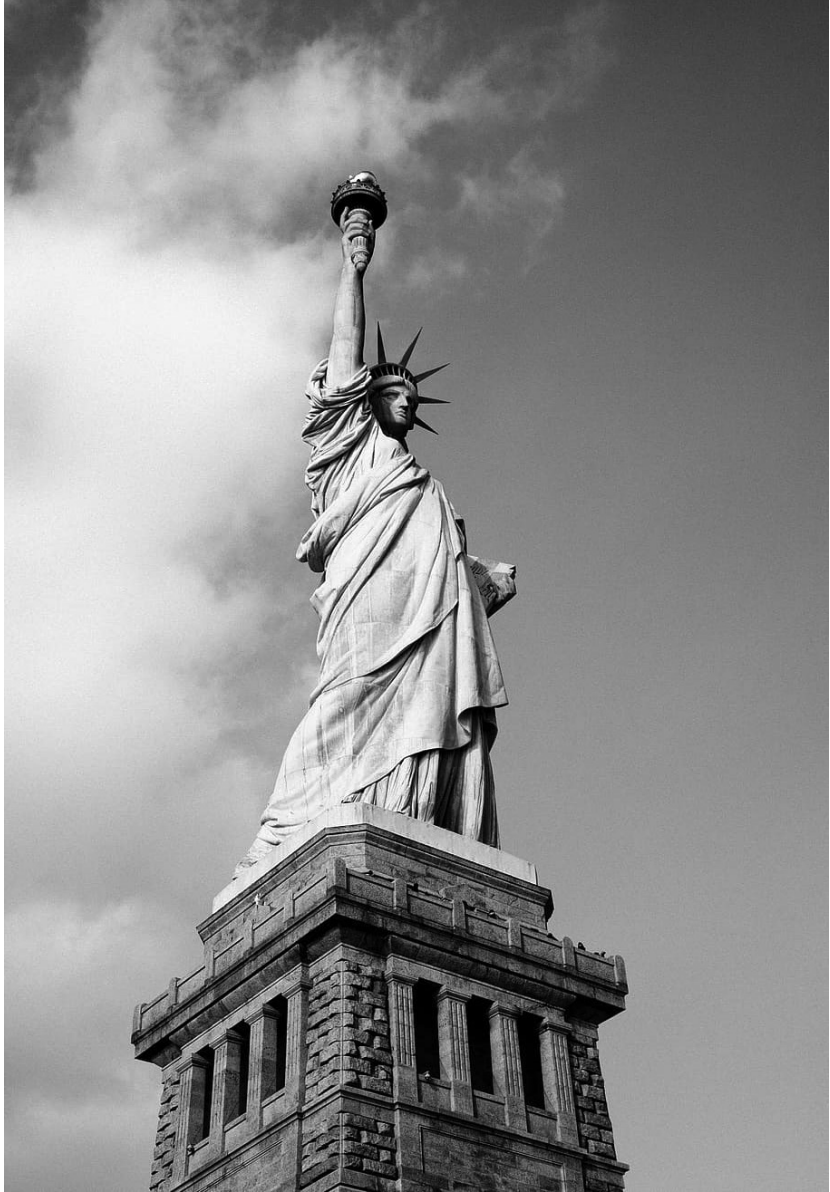
Статуята на свободата, САЩ